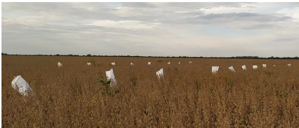
Fotografía 1. a) Plántulas de soja en TUA (izq) y tratada con Mist-VL (der), b) aplicación de Mist-Balance en V5, c) Vista general de la cosecha.